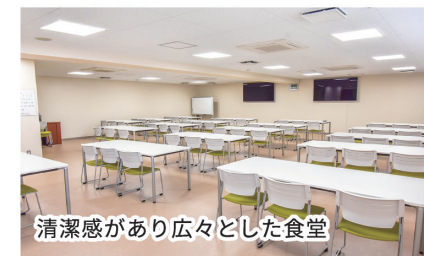
清潔感があり広々とした食堂