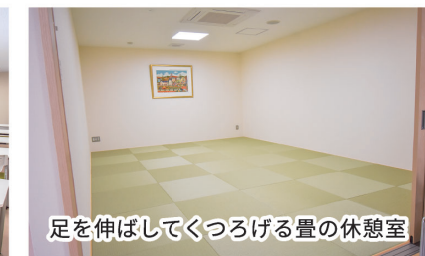
足を伸ばしてくつろげる畳の休憩室

●生産品目/建設機械部品・国内電力関連部品等の製造 ●〒992-1124 山形県米沢市万世町金谷640-2 ●TEL/0238-28-2055 ●FAX/0238-29-0081 ●設立/1976年10月 ●従業員/92名(2023年2月現在) ●HP/http://www.ohgishi.com/company.html