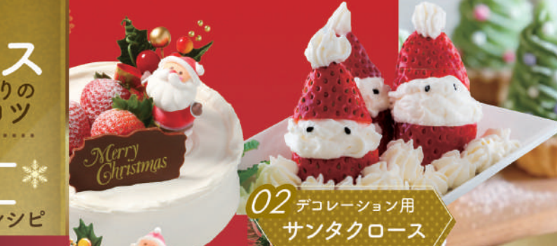
02 デコレーション用 サンタクロース