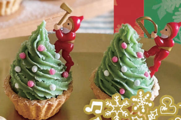
01 クリスマスツリーの ひとくちタルト